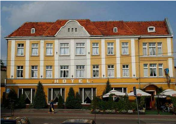
III) Hotel in Chełmno,