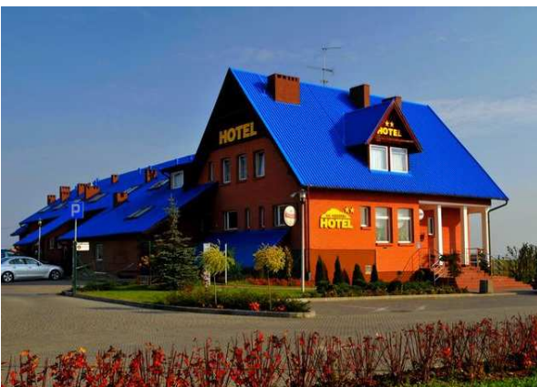
V) Hotel in Gniew,