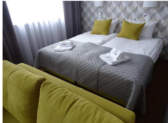
VI) Hotel in Tczew,