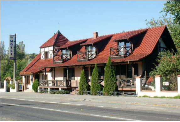
I) Motel in Toruń