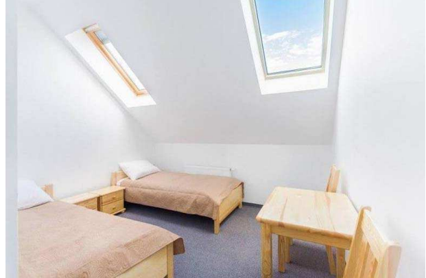
IV) Marina in Grudziądz,