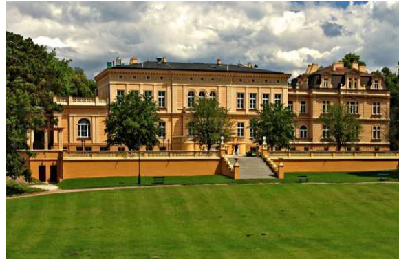
II) Hotel in Ostromecko,